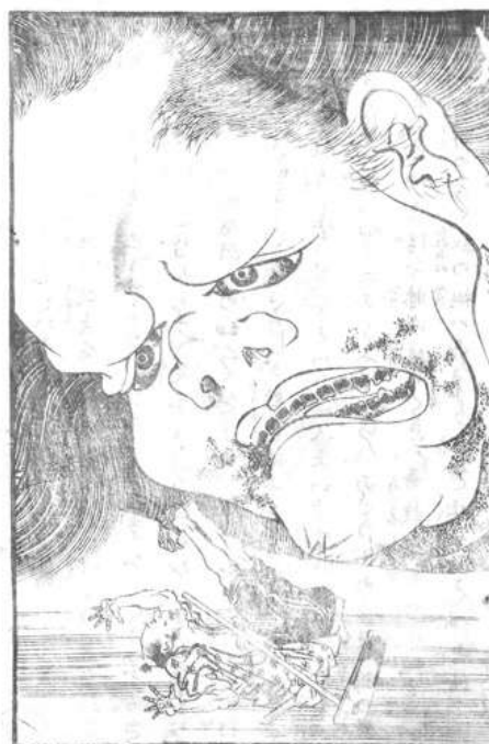
柳亭種彦著・葛飾北斎画「近世怪談霜夜星 巻四 おさほかまぐらのちにたゝりをなしさま々のばけものいつるさとびとおそろゝところ」