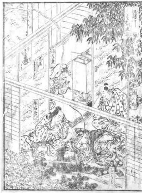
曲亭馬琴著・葛飾北斎画「新累解脱物語 巻五 藻にすむ虫」