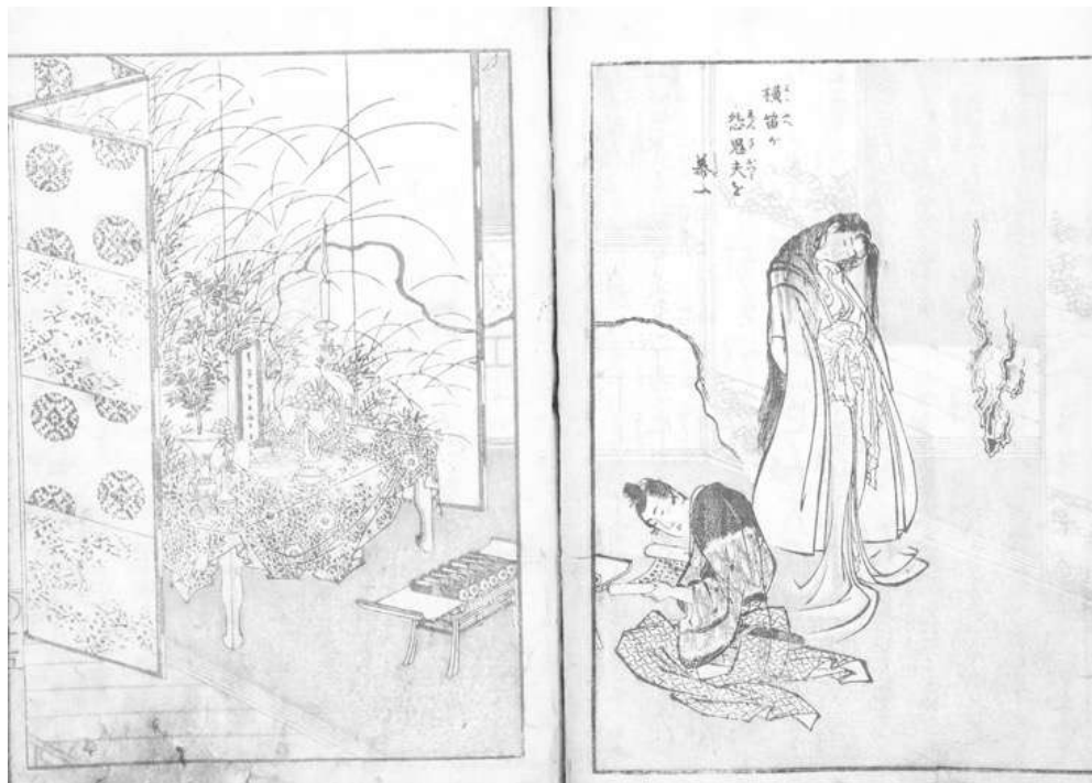
小枝繁著・葛飾北斎画「經島履歴松王物語 卷二 横笛が怨鬼夫を慕ふ」