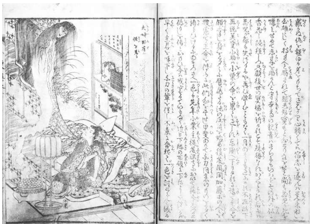
小枝繁著・葛飾北斎画「寒燈夜話小栗外伝 卷十 夫婦臥房に怪を見る」