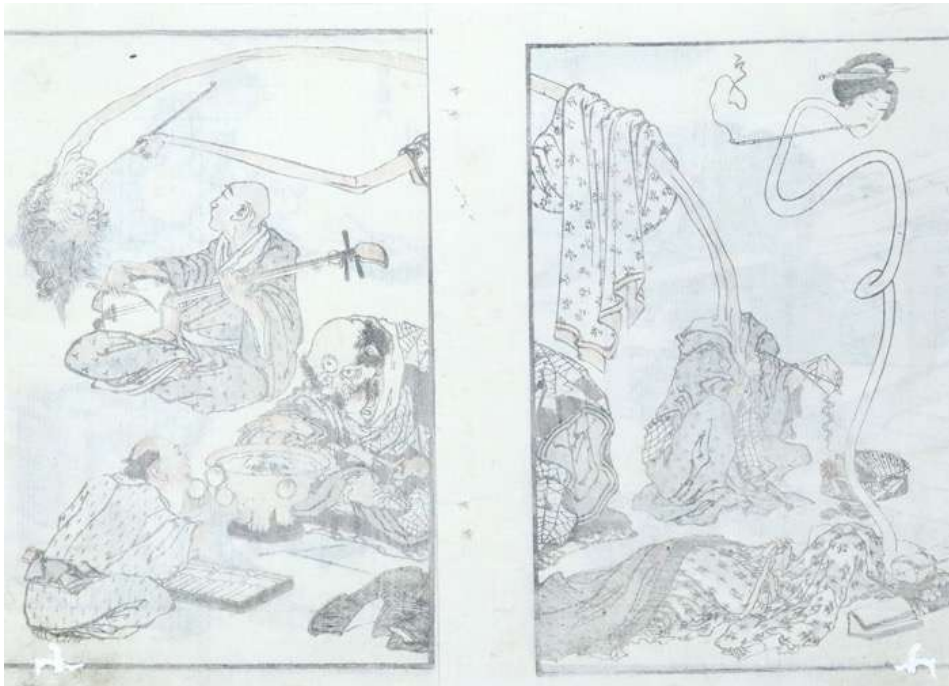
葛飾北斎「北斎漫画 十二編 ろくろ首」

怪談に頻繁に登場する妖怪は『北斎漫画』に描かれた愉快なものから人を食らう狒々のような恐ろしいものまであります。本展では北斎が描く河童やかまいたち、天狗、鶴、ろくろ首、鬼など様々な妖怪をご覧ください。