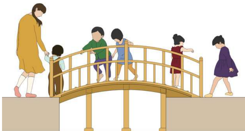
にほんばし部姿図