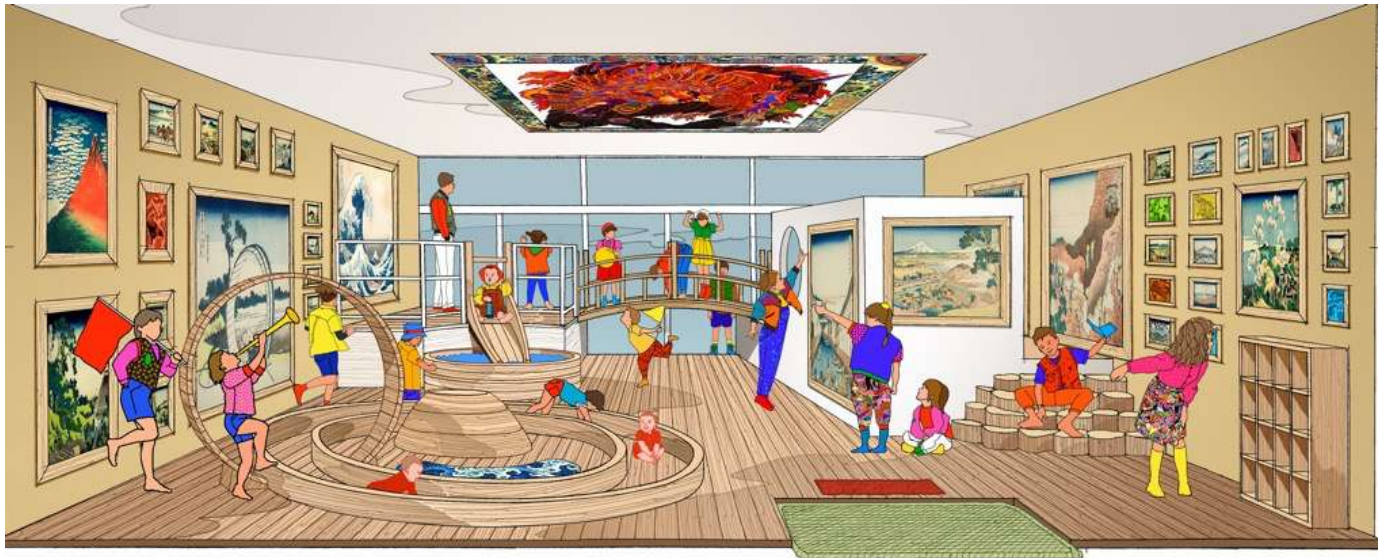
完成予想図（EJI MITOOKA + DON DESIGN ASSOCIATES, KOKI SUNADA + OFFICE FIELDNOTE）

8月1日（木）の一般公開に先駆けて、7月31日（水）に北斎館にてプレス内覧会を行いますので、ぜひこの機会に北斎と栗のまちとしても有名な小布施までお越しください。