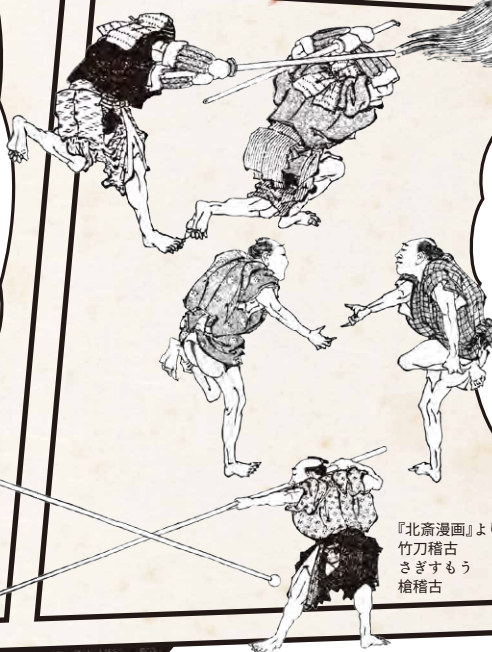
『北斎漫画』より 竹刀稽古 さますもう 槍稽古

急激な物価高を図案化した巨大うなぎに抵抗する職人たちの必死な様子は、滑稽でありながら現代の私たちにも共感できる一面を持ち合わせています。