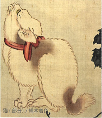
猫(部分) / 絹本着色