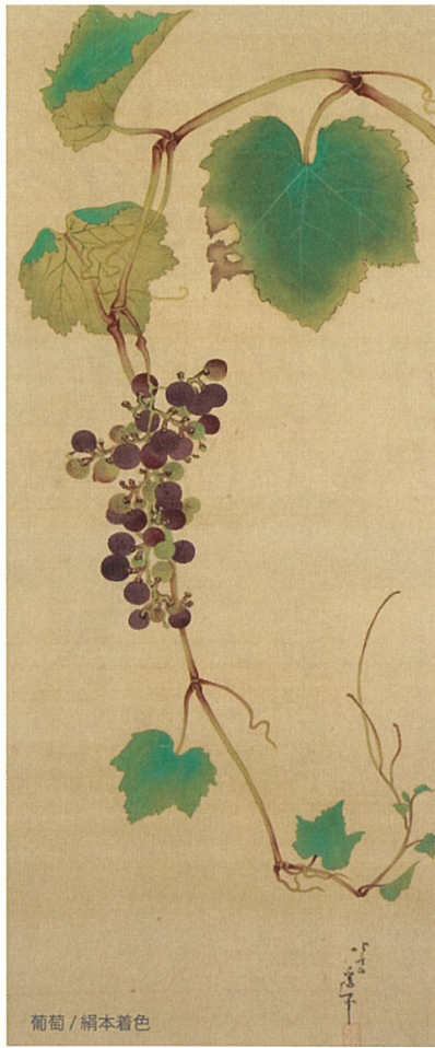
葡萄 / 絹本着色