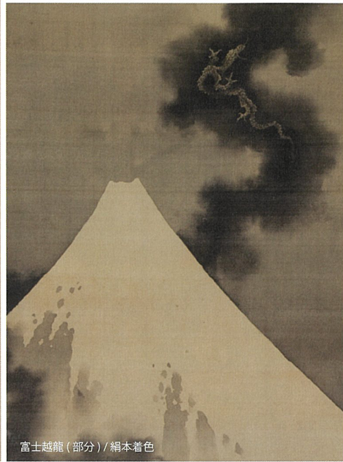
富士越龍(部分) / 絹本着色