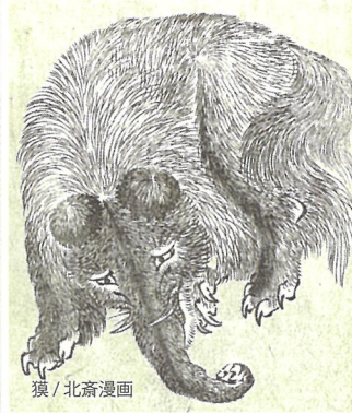
猿 / 北斎漫画